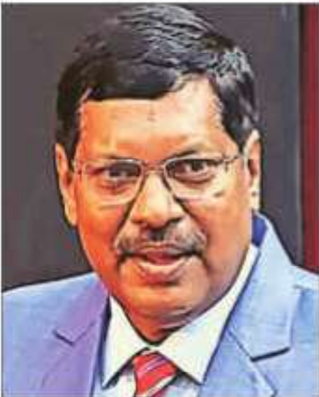
Justice B R Gavai is set to take over as CJI next month