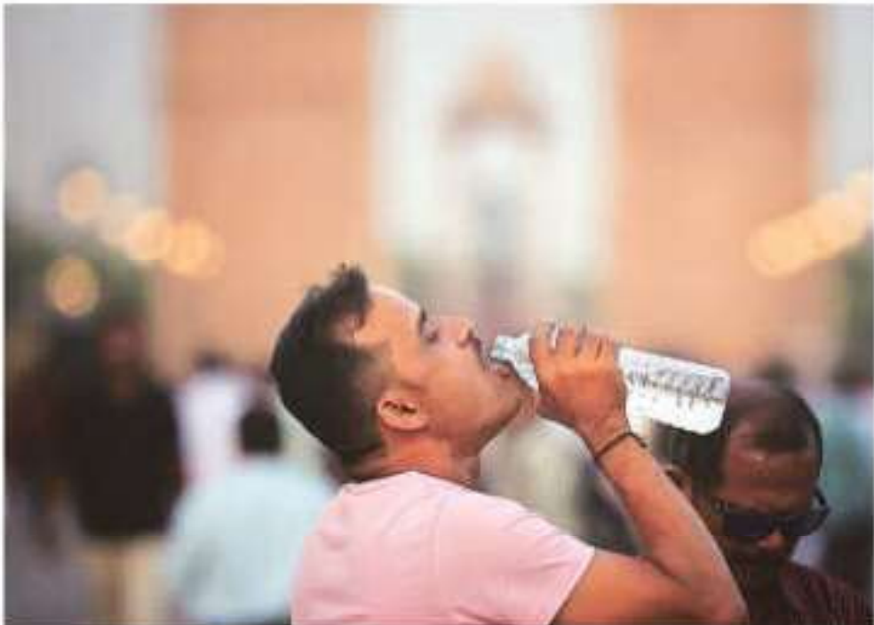
A visitor at Kartavya Path after Delhi witnesses yet another hot day on Monday

In the national capital, last year's city-specific HAP was prepared by the Delhi Disaster Management Authority (DDMA). Building on last year's groundwork, the Delhi Government has expanded the scope of its heat preparedness efforts this summer. Delhi HAP 2025 includes a range of measures — from installing water ATMs and