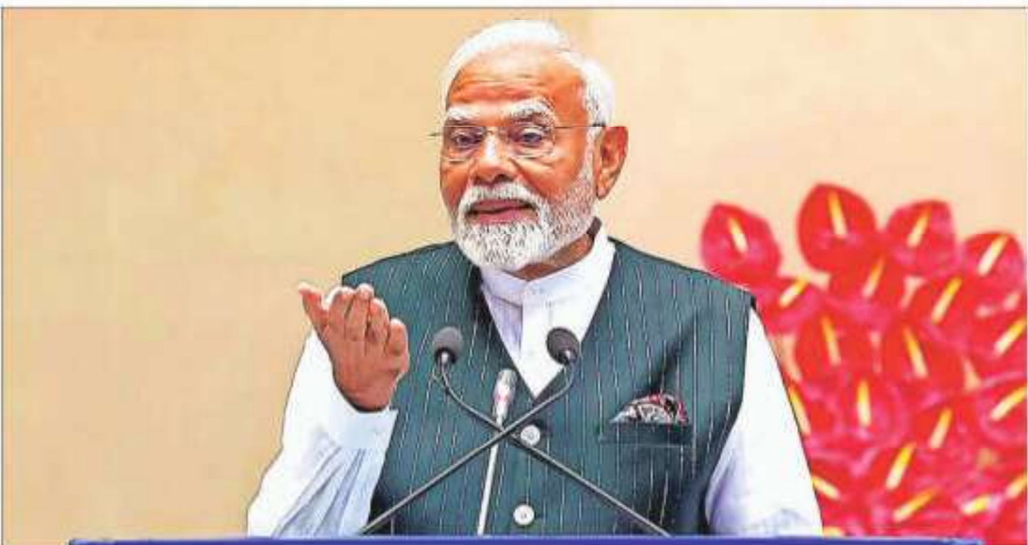
Prime Minister Narendra Modi speaks during the 17th Civil Services Day programme, in New Delhi

Reflecting on the past role of bureaucracy as a regulator controlling the pace of industrialisation and entrepreneurship, he emphasised that the nation has moved beyond this mindset and is now fostering an environ-